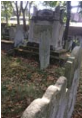
Cerrig beddi ym mynwent Bunhill.