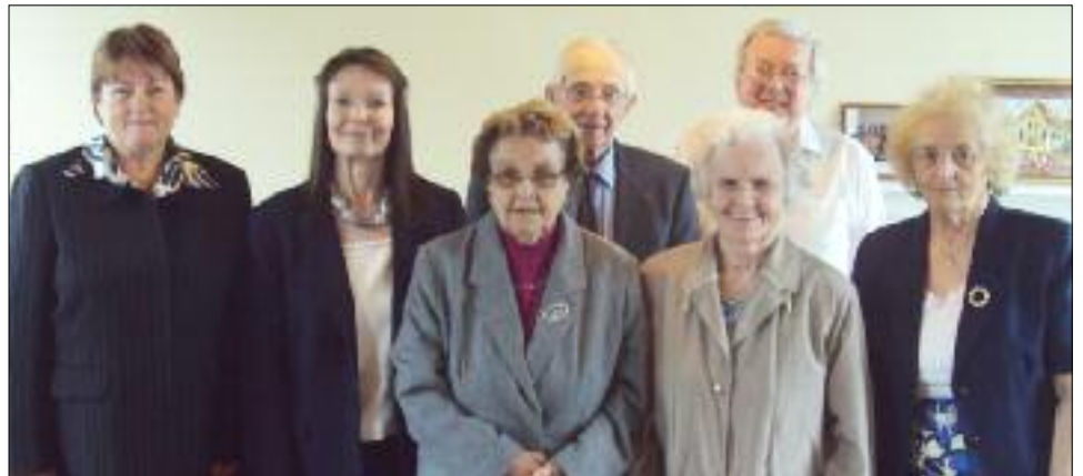
Diaconiaid newydd Eglwys Pantycrugiau, Plwmp.