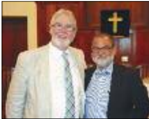
Y Parchg Ddr Geraint Tudur a'r Parchg Ddr Bruce Theron

Roedd y 'deuddeg apostol' yno i gefnogi'r Parchedig Ddr Geraint Tudur, Llywydd Annibynwyr y Byd, ac yntau yn