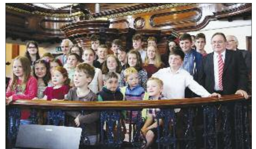
Plant Eglwys Emaus yn eu helfen