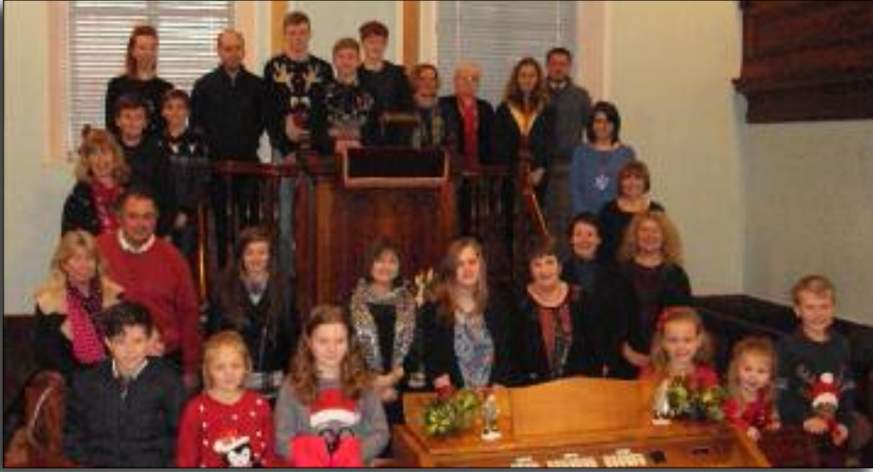
Capel Brynmoriah, Brynhoffnant