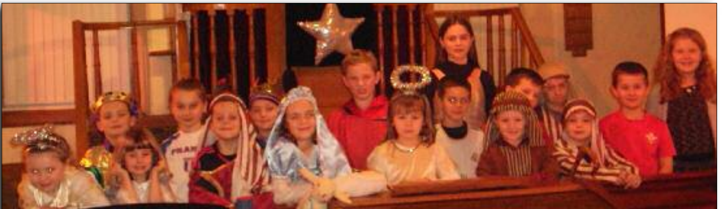
Capel Pisgah, Talgarreg