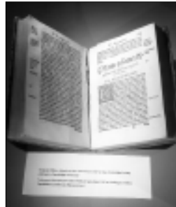
Testament Newydd Williams Salesbury yn Eglwys Llanycil

Roedd yn medru Saesneg, yn wahanol i'w gyd-Gymry bron i gyd. Medrai rai o brif ieithoedd y cyfandir; Ffrangeg, Almaeneg a Sbaeneg. Wrth gwrs medrai Ladin; dyma iaith ei hyfforddiant ac iaith dysg. Yn dyngedfennol medrai Hebraeg a Groeg. Y llawysgrifau hynny oedd ganddo yn cyfieithu'r Salmau a'r Testament Newydd ohonynt; nid cyfieithu o gyfieithiadau a wnâi. Pan holid ef a oedd ei feistrolaeth o'r Gymraeg gymaint â'r ieithoedd eraill, barnai ei fod yn fwy hydrys yn iaith ei fam na'r un.