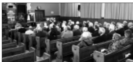
Darlith Cymdeithas Hanes yr Annibynwyr yn Llansannan