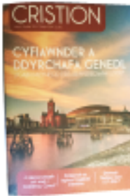
Y Cristion Medi/Hydrif