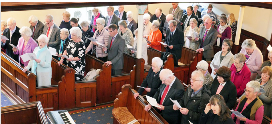
Rhan o'r gynulleidfa luosog ym Mheniel