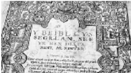
Beibl William Morgan

Llund dwrn o bregethwyr ein capel ni sy'n darllen o Feibl William Morgan mewn oedfaon bellach ac erbyn hyn mae'n swinio braidd yn quaint ac, i fod yn onest, ychydig yn ddigri os nad yn annealladwy. Er enghraifft: "Ac yr oedd chwegr Simon yn glaf o gryd blin: a hwy a atolygasant arno drosti hi." (Luc 4: 38) Faint o bobl yn ein cynulleidfaoedd heddiw fyddai'n deall hynny?