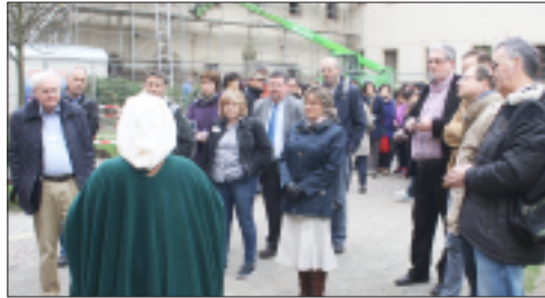
Rhai o'r cynadleddwyr ar daith gerdded o gwmpas Wittenberg