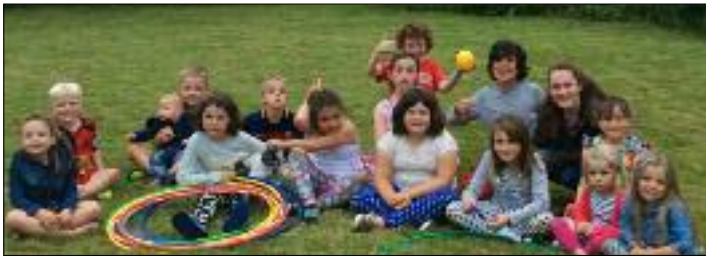
Roedd plant Ysgol Sul Caersalem, Pontyberem, wrth eu bodd ac yn cael hwyl yn y sesiwn gemau yn dilyn barbeciw diwedd Tymor yr Ysgol Sul. Edrychwn ymlaen at eich croesawu yn ôl i'n plith ym mis Medi.