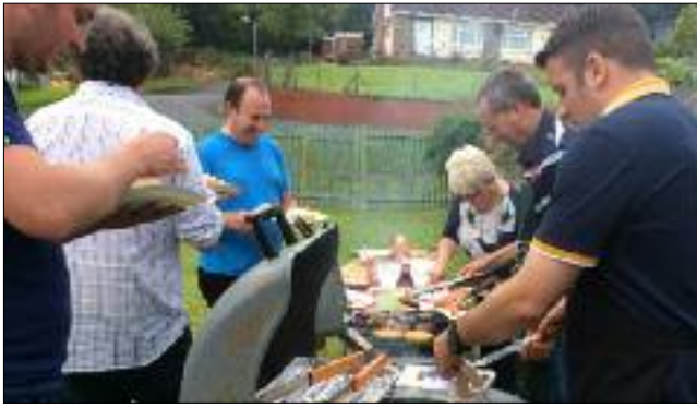
Y dynion yn coginio barbeciw blasus iawn nos Wener 10 Gorffennaf 2016 gan ddathlu gweithgareddau'r Ysgol Sul.