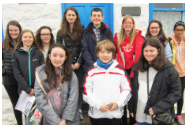
Y criw y tu allan i Capel Penlan, Pwllheli

Wedi oedi peth ym Mhllheli i gael cinio aethom ymlaen i Aberdaron, i Eglwys Hywyn Sant, yr Eglwys sydd ar y llethr ger y traeth. Roedd llawer o bobl a phlant yn yr Eglwys gan fod yno fwrlwm o weithgareddau dros gyfnod y Pasg. Braff oedd gweld plant yn chwarae â theganau ac yn gwneud lluniau a theuluoedd ifanc yn