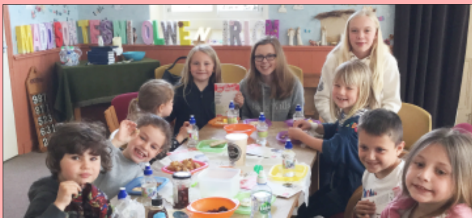
Ysgol Sul Salem, Porthmadog