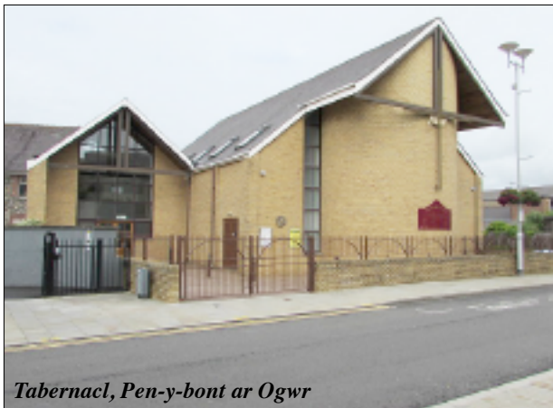
Tabernacl, Pen-y-bont ar Ogwr